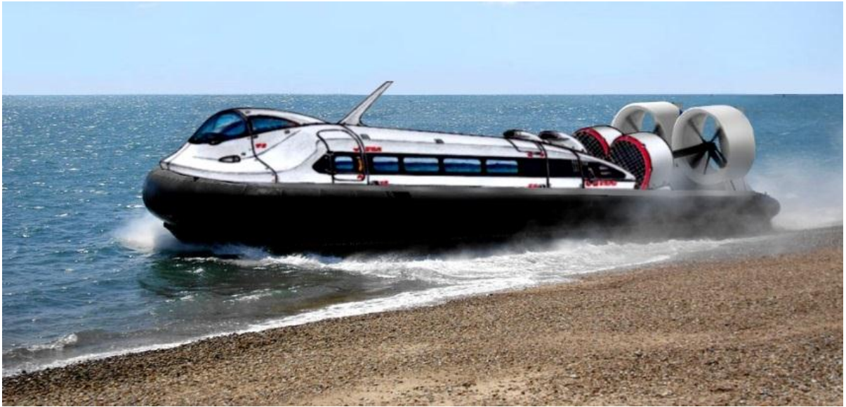
Общий вид АСВП на 20 пассажиров.